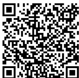
観光パンフレット